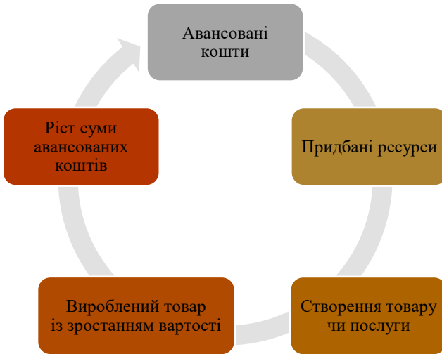
Рис. 2. Цикл економічної складової механізму реалізації підприємницької діяльності

надавати новий тип послуг), або дозволять підприємцям зробити спробу виходу з товарами, що раніше вже випускалися, але на нові ринки. На цьому процес звернення товарів та грошей переривається і починається процес виробництва, під час якого економічні ресурси перетворюються на продукт із заданою корисністю, тобто створюється нова вартість [6]. Після реалізації на ринку суб'єкт підприємництва отримує суму, що перевищує спочатку авансовані кошти.